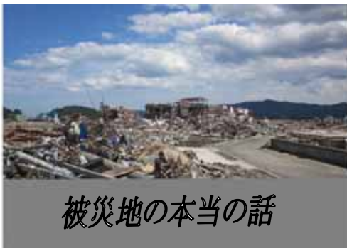
被災地の本当の話

私たちは、これまで水俣病・アスベスト等の公害や原発の安全神話に薄っぺらい知識で片付け、平和な現代だと思っていました。あの大地震時原発の爆発で、大変なことになる東京も危ないと避難された人たち。そして私たちも放射能の恐ろしさ、広がりには驚かされている毎日が続いています。一方被災地での住まい・家族・人とのつながりを結ぶ場の喪失は、社会的孤立を意味します。報道では聞けない現場と私たちのできることを考えてみませんか。