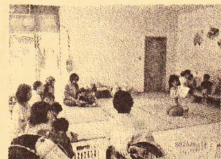
読み聞かせの様子