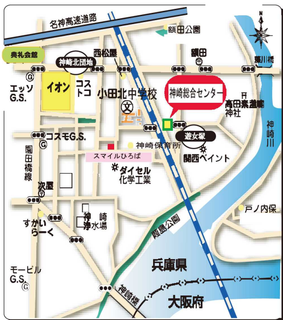
神崎総合センター地図

詳しくは http://www.city.amagasaki.hyogo.jp/map/institution/01_019.html