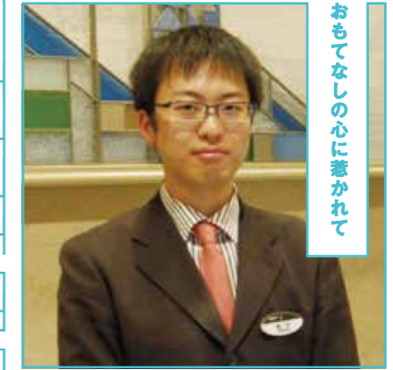
おもてなしの心に惹かれて