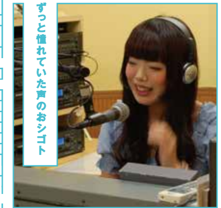
ずっと慣れてきた声のおシゴト