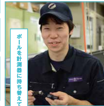
ボールを計測器に持ち替えて

【個人情報について】ご記入いただいた個人情報は、本セミナーに係る管理運営の目的に限り使用させていただきます。