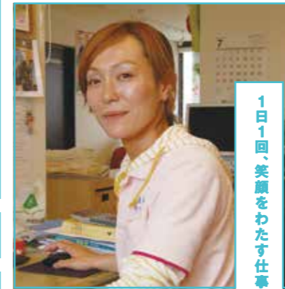
1日1回、笑顔をわたす仕事