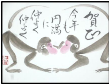
作品例(年賀八ガキ)