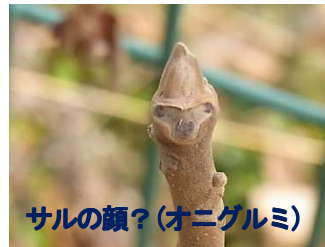
サルの顔? (オニグルミ)