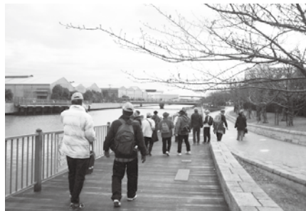
尼崎運河を散策する参加者 (昨年度)