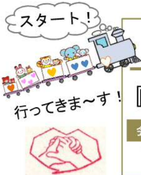
スタンプをあつめよう!

各回どなたでも参加できますが、ツアー参加登録をされた方には、スタンプカードをお渡しし、最後までいくと景品を贈ります! 随時受け付けていますので、どしどし登録してください。