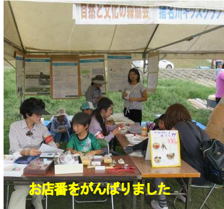
お店番をがんばりました

なまちゃんの運行も手伝いました。最後まで残って後片付けや会場のゴミ拾いもしました。楽しい一日でした。