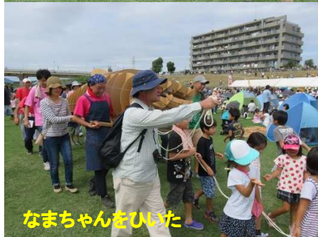
なまちゃんをいいた