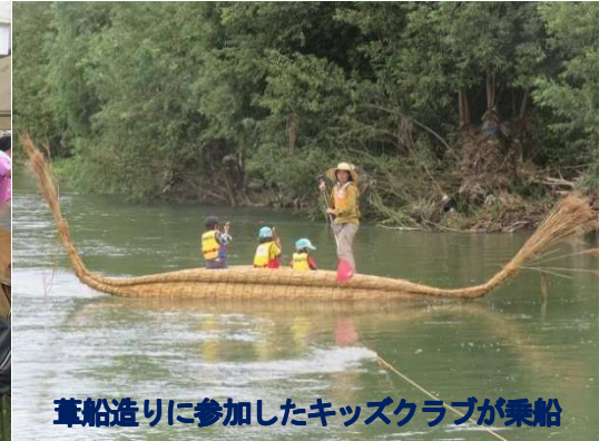
葦船造りに参加したキッズクラブが乗船