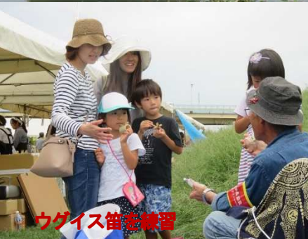
ウグイス笛を練習