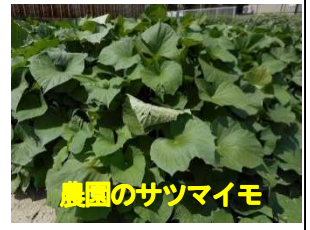
農園のサツマイモ