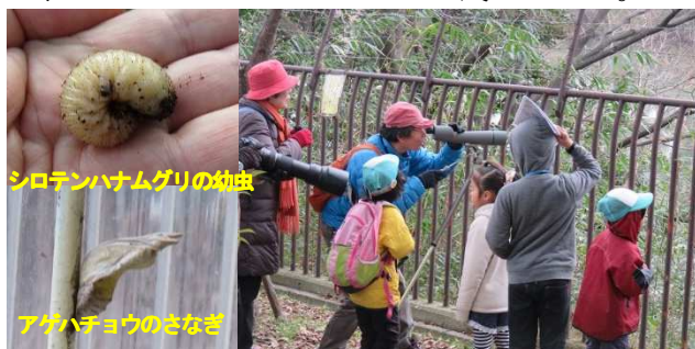
シロテンハナムグリの幼虫