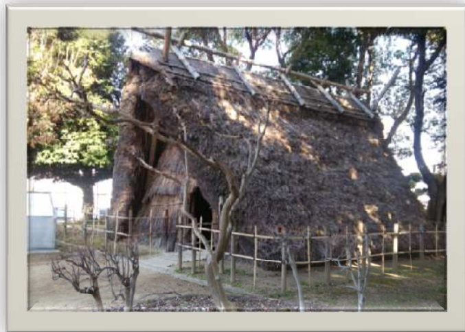
葺き替え予定の方形竪穴住居