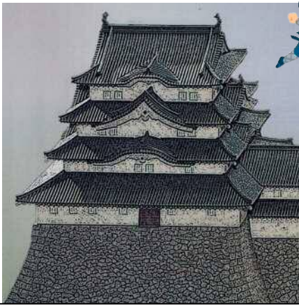
「尼崎城の歴史」より (尼崎市教育委員会 歴博・文化財担当)