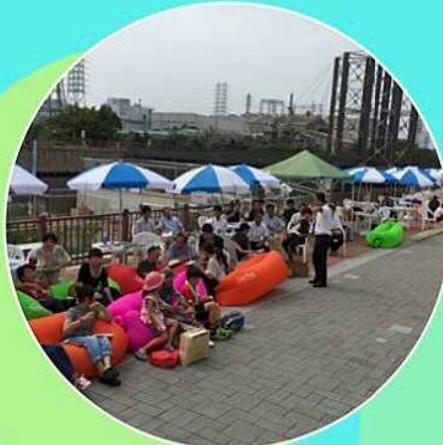
ゆっくり時間が流れる運河でくつろごう!