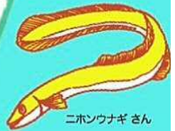
ニホンウナギさん