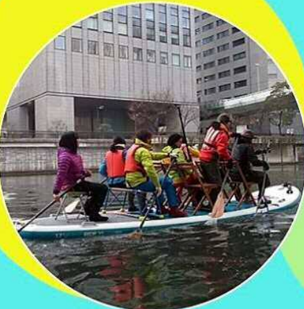
SUPに乗って、運河を満喫!