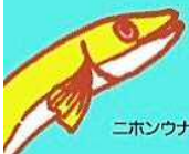
ニホンウナギさん