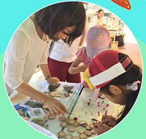
尼崎運河の特産品を楽しく作っちゃおう!