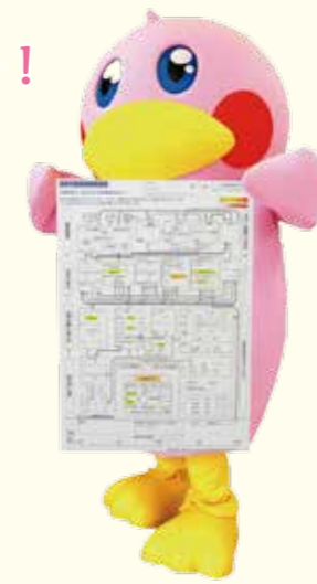
「健診すすめ隊」キャラクター すすめスズメと健診結果構造図

本市では市民の皆さんの健康寿命の延伸に向け、生活習慣病やその重症化を予防するため、年に一度の健診の受診をお勧めしています。詳しくは健康支援推進担当 ☎6489-6797へ。