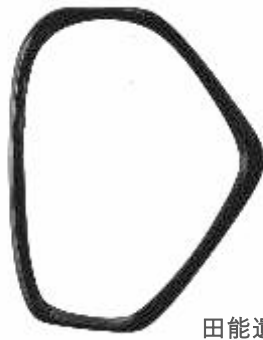
田能遺跡出土 白銅製釧(腕輪) (兵庫県指定文化財)