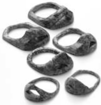
新方遺跡出土 鹿角製指輪