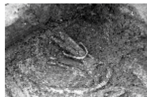
田能遺跡第17号墓 白銅製釧(腕輪)の出土状況

田能遺跡第16号墓出土 碧玉製管玉(首飾り)(兵庫県指定文化財) 田能遺跡第17号墓出土 白銅製釧(腕輪)(兵庫県指定文化財) 大型甕(田能遺跡第4調査区第6溝出土) ミニチュア土器(田能遺跡第4調査区第6溝出土)など