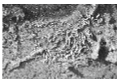
田能遺跡第16号墓 碧玉製管玉(首飾り)出土状況