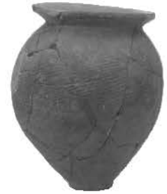
炊飯に使う甕 (田能遺跡)