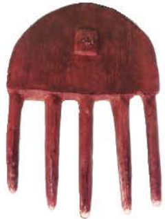
またぐわ (復元品) (田能資料館)