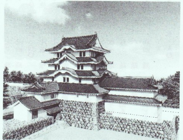
尼崎城予想図 2018年秋完成予定