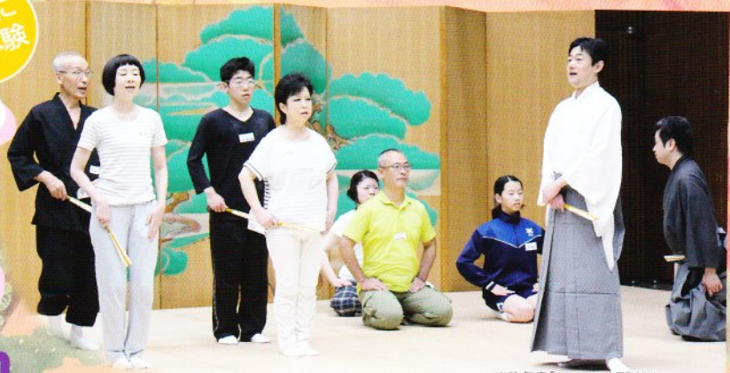
※昨年度「ちゃっと狂言」稽古風景

こっけいな動き&セリフで笑わせる古典喜劇・狂言。 実際に体験して、新たな魅力を発見しよう！本格的な舞台上で大きな声 を出し、元気いっぱい動き、全身で日本の古典芸能に触れてください。 小学4年生から大人の方まで、老若男女問わずご参加いただけます。