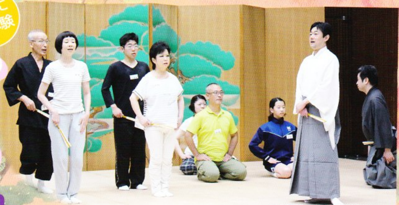
※昨年度「ちやっと狂言」稽古風景

こっけいな動き&セリフで笑わせる古典喜劇・狂言。 実際に体験して、新たな魅力を発見しよう！本格的な舞台上で大きな声 を出し、元気いっぱい動き、全身で日本の古典芸能に触れてください。 小学4年生から大人の方まで、老若男女問わずご参加いただけます。