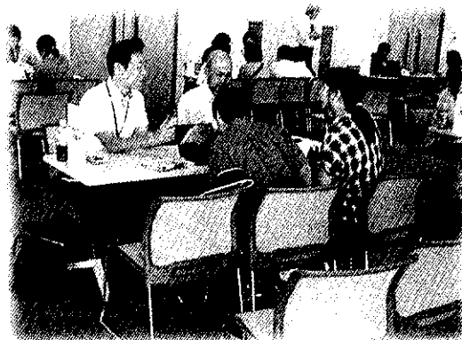
平成29年度事業所説明会での 個別相談の様子