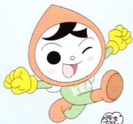
人権イメージキャラクター 人KEN まもる君