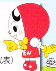
人権イメージキャラクター 人KEN あゆみちゃん

主催：尼崎市／尼崎人権啓発活動地域ネットワーク協議会 (尼崎市・神戸地方法務局尼崎支局・尼崎人権擁護委員協議会) 協賛：(公社) 尼崎人権啓発協会／尼崎市人権・同和教育研究協議会／企業人権・同和教育合同研究会 問合せ：尼崎市市民協働局ダイバーシティ推進課 (Tel. 06-6489-6658 Fax.06-6489-6661) 尼崎市中小企業センター (Tel. 06-6488-9501 (代))