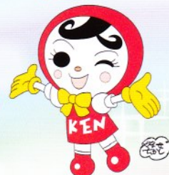
人権イメージキャラクター 人KEN あゆみちゃん