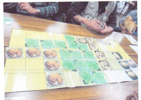
サンゴのテリトリーウォーズ実施中