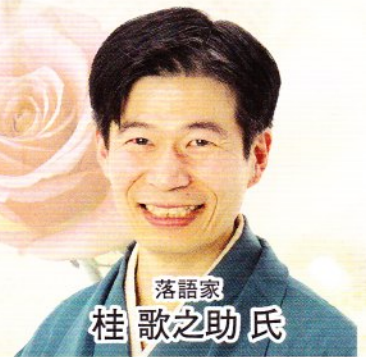
落語家 桂 歌之助氏