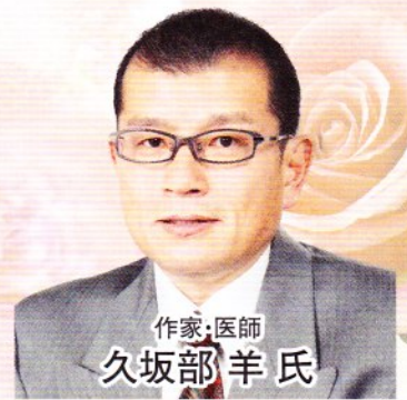
作家・医師 久坂部 羊氏

会場 あましんアルカイックホール・オクト 尼崎市昭南通2-7-16 TEL.06-6487-0800 ※阪神本線「尼崎」駅より立体遊歩道で北東へ徒歩約5分(国道2号線沿い)