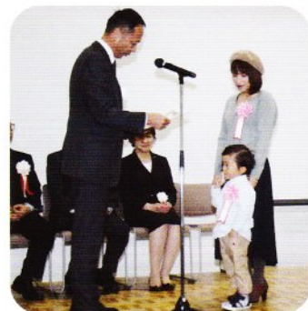
② 親子よい歯のコンクール