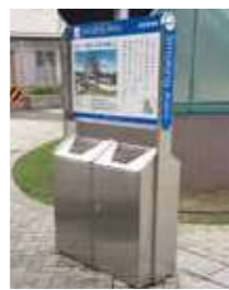
J R 尼崎駅北側喫煙所