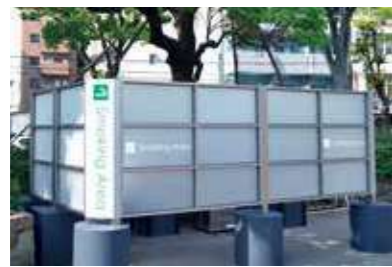
J R 尼崎駅南側喫煙所