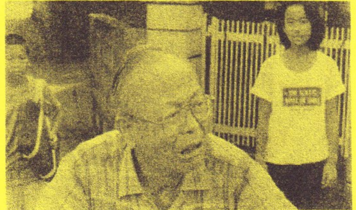
拓三が踏切へ走り出す……様子がおかしい！