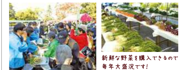
新鮮な野菜を購入できるので毎年大盛況です!

11月4日(日)午前9時30分～午後3時、橘公園で。野菜の品評会や尼諸の加工品(焼酎「尼の掬」・つくだ煮「尼いものつるの炊いたん」・パウンドケーキ)・市内野菜・スイーツ・米の販売のほか、植本市、野菜の盛り合わせが当たる抽選会、ジャンボ野菜重さ当てクイズ、輪投げコーナーなどを。☎不要。