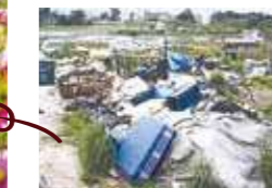
かつては荒廃していた河川敷

尼崎の名所になっている同コスモス園で秋を感じてみませんか。☎無料。臨時駐車場あり(¥500円～2,000円)。