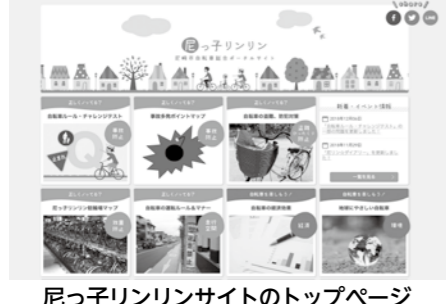
ニっ子リンリンサイトのトップページ