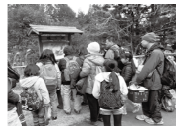
昨年はハイキングなどを 行いました

☎市内在住の小学3～6年生 ☎30人 ☎2,000円 ☎1月12日(必着)までに往復はがき(1枚4人まで)に応募者全員の住所・氏名・電話番号・学校名・学年・性別、保護者氏名を書いて青少年センター青少年課。