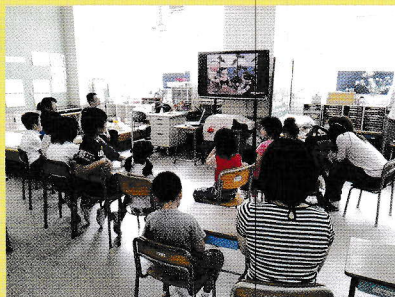
小学校での尼いもの学習(左:苗植え付け、右:教室での学習)