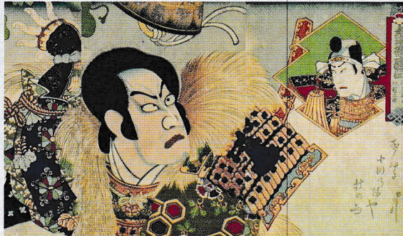
(上) 国周 絵本太功記十段目光秀(部分) (左) 芳年 新形三十六怪撰 大物浦知盛出現