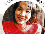
高橋 真実子 (アナウンサー)