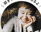
和田 のあ (フォトグラファー)