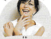
SAWA (ファッションモデル)