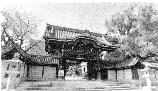
顕証寺 河内名所図絵