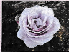
ローズアマガサキ 2016