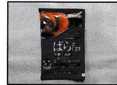
バラ肥料のお土産付き！