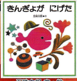
五味太郎 文・絵 福音館書店 刊

みんなできんぎょをみつけて、 いっしょに歌う♪音楽影絵♪ うた おんがく かけえ