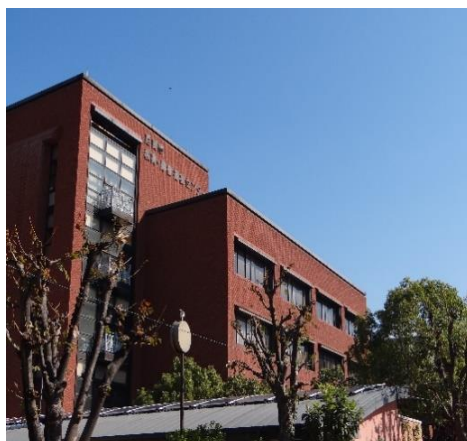
尼崎市立身体障害者福祉センター