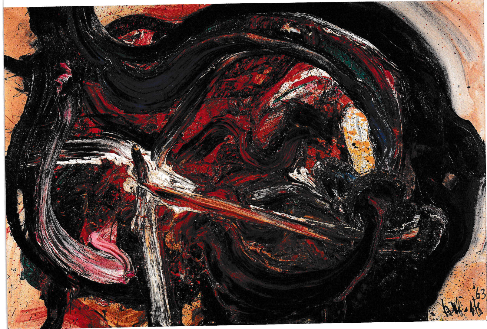
《天宮星撰天雕》 尼崎市蔵 1963年