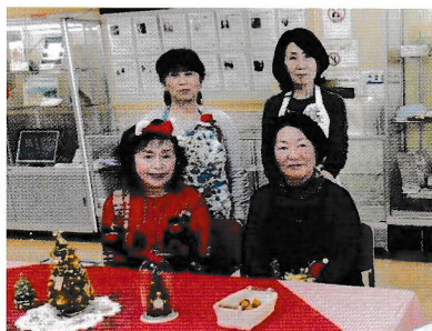
毎回楽しみに来ています

2010年からコープカルチャー宝塚のロビーで、元気の出るコーヒーサロンを開催しています。年代をこえてお話ができ、情報を交換できる場として活動しています。コロナの感染拡大を受け、活動を長い間お休みせざるを得ない状況でしたが、11月から感染対策をして再開しています。今月は、 1月17日（火）に日程を変更して開催します。 ぜひ、お越しください。