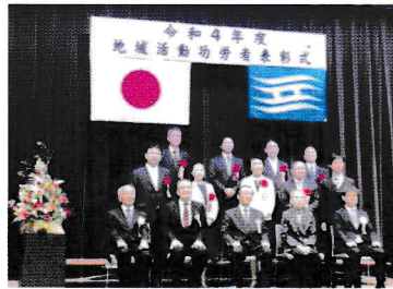
2022年11月13日（日） 宝塚市立中央公民館

開催日時：毎月第2・4土曜日、 13：00～15：00 開催場所：UR逆瀬川団地集会所