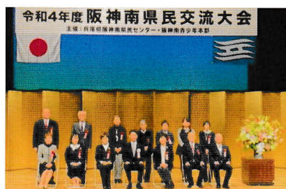
2022年11月24日（木） 尼崎市総合文化センター

活動日時：奇数月第1土曜日、 偶数月第2土曜日 9：30～12：30 活動場所：コープ塚口 組合員集会所