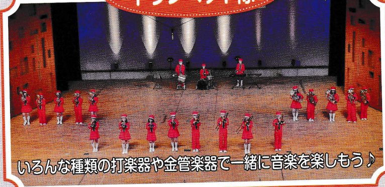
いろんな種類の打楽器や金管楽器で一緒に音楽を楽しもう♪