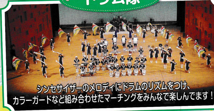
シンセサイザーのメロディにドラムのリズムをつけ、 カラーガードなど組み合わせたマーチングをみんなで楽しんでます！

尼崎市少年音楽隊は、「明るく 健やかな心を持った青少年の育 成」と「街に爽やかな音楽を響 かせよう」という願 いを込めて、昭和37年 に創立されました。