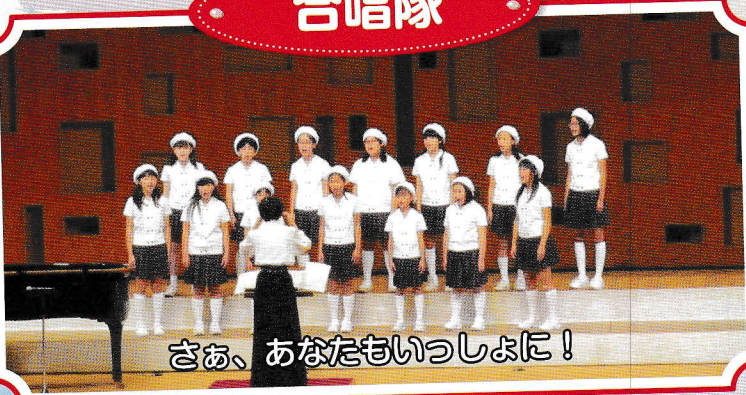
さあ、あなたもいっしょに！