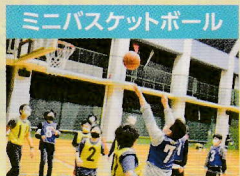
ミニバスケットボール