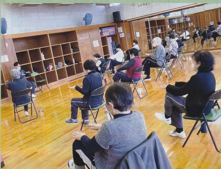
からだ元気体操 ～認知症予防～