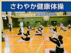
さわやか健康体操

スポンジテニスの基本ストローク・基礎のルールを理解し、楽しく身体を動かして 技術の向上を図ります。