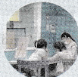
親子でも、ママやパパだけでも、お友達同士でも自由にお立ち寄りください