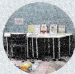
絵本や玩具、マットなども少しありますよ