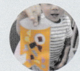
保育士・幼稚園教諭が手作りのクラフトも準備しています☆お子様と一緒に作って遊んで下さいね