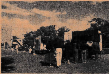
公園を活用する社会実験で、当日は噴水広場にキッチンカーが登場!

10月18日に「尼大ランチミーティング」と題して、尼崎市役所の隣にある橋公園で市職員と市民が青空の下、ランチを食べながら交流するミーティングを開きました。職員と市民もあわせて50人以上の参加者が集まりました。 この日に「救急現場のことを知ってほしい」と相談された消防局の皆さん。その後事務局と相談を重ねてインスタグラムで啓発の動き 今年度も相談室は偶数月の第2水曜日にあまがさき・ひと咲きプラザで開催します。ぜひご参加ください!