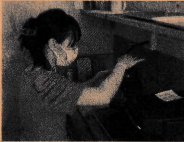
まごころ茶屋でコーヒーメーカーに挑戦！