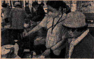
オープンカレッジ広場で「あちもんで交歓会」のお手伝い

中央地区の「護美奉行」は「刀トング」というトングの握る部分が刀の柄になっているオリジナルのトングを使って尼崎城・寺町周辺を清掃している団体です。刀トングをお借りし、私たちが清掃活動に参加させていただきました。清掃活動だけでなく、歩きながら代表の方が尼崎城や寺町の歴史にまつわる話をしてくださいました。 他にもたくさんさんの団体さんの活動のお手伝いをさせていただきました！気になる活動がある方は、事務局までご連絡ください。