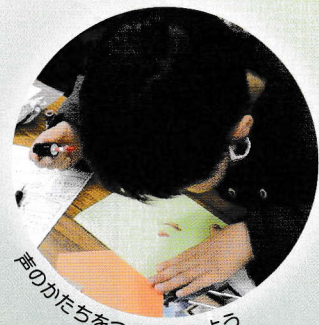
声のかたちをつくってみよう

申込方法 メールか直接窓口で文化振興課まで ※メールでの申込の場合、「ワークショップ名」「日程」「氏名(保護者同伴の場合は保護者も)」「住所」「年齢・学年」「電話番号」を記載してください ※応募者多数の場合は抽選 メール ama-event@city.amagasaki.hyogo.jp