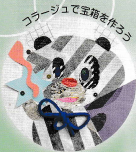
コラージュで宝箱を作ろう

アート発信基地 えーらぼ 「A-LAB」では、日頃、若手アーティストの展覧会やワークショップを開催しています。今回「A-LAB」を飛び出し、市内各地域に向かい生涯学習プラザでワークショップを行います。第1回白髪一雄現代美術賞受賞者をはじめとする、市内外で活躍するアーティストたちと一緒に、楽しくアートを体験してみよう!