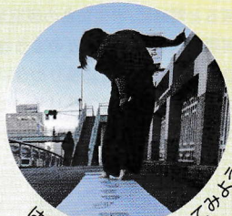
はだしの地図をつくってみよう

アート発信基地 えーらぼ 「A-LAB」では、日頃、若手アーティストの展覧会やワークショップを開催しています。今回「A-LAB」を飛び出し、市内各地域に向かい生涯学習プラザでワークショップを行います。第1回白髪一雄現代美術賞受賞者をはじめとする、市内外で活躍するアーティストたちと一緒に、楽しくアートを体験してみよう!