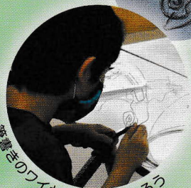
一筆書きのワイヤーアートを作ろう