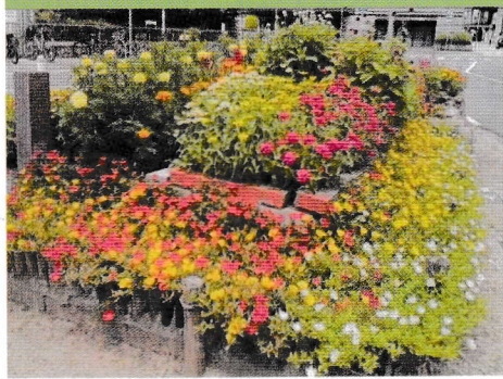
コミュニティ緑化部門 優秀賞 猪名寺駅前花壇 様