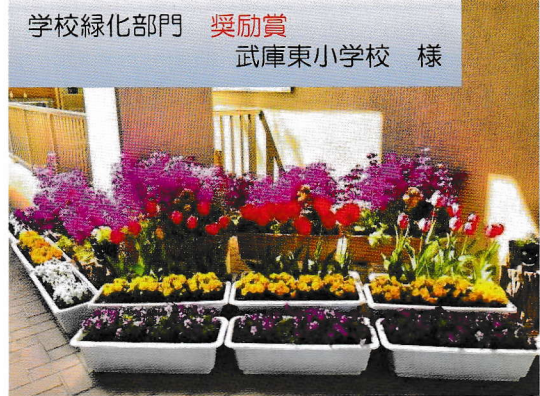
学校緑化部門 奨励賞 武庫東小学校 様