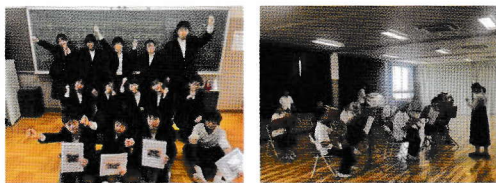
尼崎朝鮮初中級学校吹奏楽部の皆さん