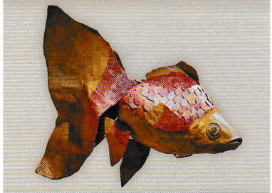
Adapted fish 2021年 ©Tamada Taki