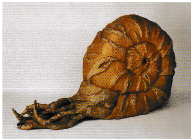
ネオアンモナイト 2015年 ©Tamada Taki