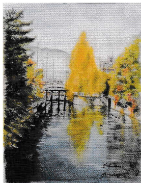
優秀賞「蓬川の初秋」