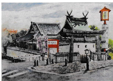
最優秀賞「櫻井神社」