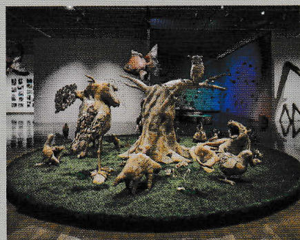
※画像は別会場の展示風景です