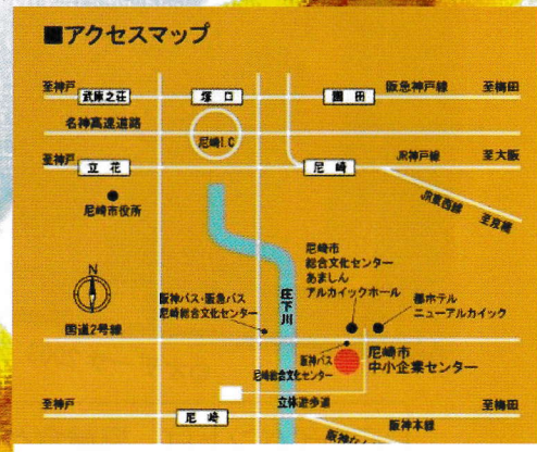
阪神尼崎駅より徒歩約5分（北東へ350m）

内容：ウクライナの映像とスピーチ 小劇・舞台・歌 子どもたちと千羽鶴・ミサンガづくり 入場料：1,000円（チケット販売）