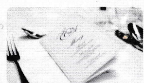
(飲食店様) メニュー開発の お手伝い

一度は食べてみたい全国の嚥下食をお取り寄せする試食会や、嚥下食レストランへの外食支援など、介護食の情報交換や生活に役立つ内容をご用意いたします。