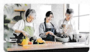
介護食・嚥下食調理実習

彩り豊かな嚥下食や、食べやすい介護食まで、簡単においしく作ることを目的に、和気あいあいと調理実習をします。