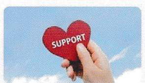
実践サポート 相談支援

身近な食材を使い、食材本来のうまみを味わえる嚥下食・介護食と一緒に作ってみませんか。経験豊富な調理師や介護食士が指導いたします。