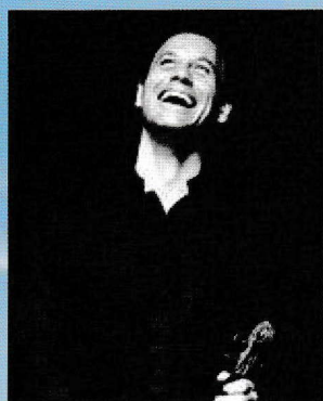
ヴァイオリン・コルシカ音楽祭総監督 ベルトロン・セルベラ Bertrand Cervera