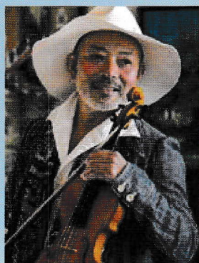
ヴァイオリン 古澤巖 Iwao Furusawa