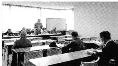
第77回文芸祭大会(作品研究会)

短歌・俳句・川柳の各部門ごとに分かれて、選者と一緒に応募作品に対する作品研究会を行います。是非この機会に、ご自分の作品を選者とともに見つめてみませんか。新しい発見があるかもしれません。どなた様もお気軽にご参加ください。