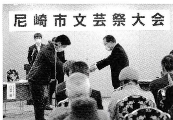
第77回文芸祭大会(表彰式)

各部門の入賞者を表彰し、賞状と記念品を贈呈します。 ※佳作の方の賞状は、作品研究会で贈呈します。